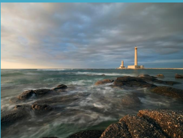
Phare de Gatteville