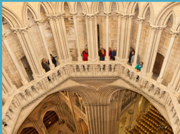
Cathédrale de Coutances

Il é thé une fois à Coutances (nouveau) est un salon de thé alliant épicerie fine et petite restauration dans un cadre invitant au lâcher prise. Un petit coin lecture a même été prévu. www.facebook.com/epiceriefine.salondethe.coutances