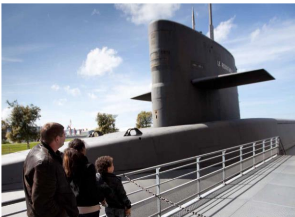
Le Redoutable

Idée restaurant : Club Dinette à Cherbourg (nouveau) - Depuis août cette adresse originale propose le midi une cuisine locale et responsable avec sa cantine bio. Salon de thé l'après-midi, l'endroit est animé le soir dans sa version bar et dédié au brunch le week-end. www.facebook.com/clubdinette/