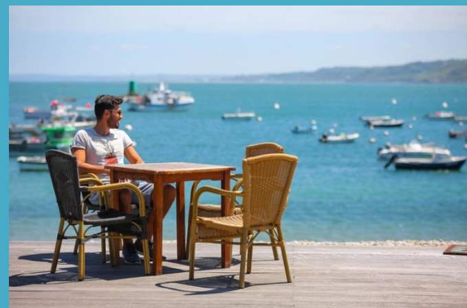
Port d'Omonville-la-Rogue