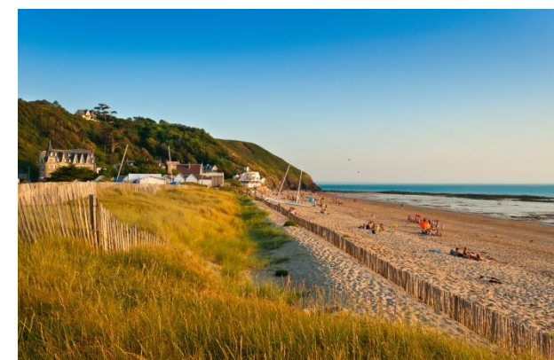
Plage de Carolles