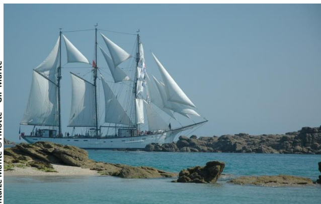
Intuile Marité